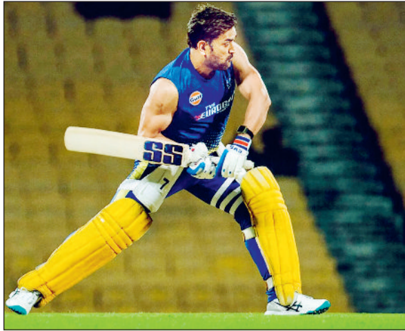
कहा था कि वह दो सप्ताह के लिए बाहर हुए हैं। वह अभी काफ स्ट्रेन से जूझ रहे हैं। वहीं ब्रेविस को साइड स्ट्रेन के चलते पहले मुकाबले से

ये दोनों चोटों की वजह से राजस्थान के खिलाफ मैच से बाहर रहे थे। ये हैं महेंद्र सिंह धोनी और डेवाल्ड ब्रेविस। हालांकि दोनों के खेलने पर अभी तस्वीर साफ नहीं हुई लेकिन ट्रेनिंग में आने से बूस्ट मिला है। धोनी के बारे में चेन्नई ने