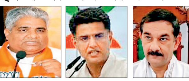
भूपेंद्र यादव सचिन पायलट जितेंद्र सिंह