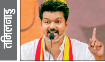
तमिलनाडु विधानसभा चुनाव में इस बार एक नया चेहरा चर्चा में है। अभिनेता से नेता बने विजय थलापति की पार्टी टीवीके पहली बार चुनावी मैदान में उतरी है और आते ही उसने राजनीतिक माहौल को बदल दिया है। लोक पाल सर्वे के मुताबिक टीवीके को 8 से 10 सीटें मिल सकती हैं। सीटों के हिसाब से यह संख्या भले कम लग रही हो, लेकिन इसका असर राजनीति पर साफ दिखाई दे रहा है। अगर वोट प्रतिशत की बात करें तो डीएमके गठबंधन को करीब 40.1 फीसदी वोट मिलने का अनुमान है, जिससे वह सबसे आगे नजर आ रहा है। वहीं एआईएडीएमके और बीजेपी के गठबंधन को लगभग 29 फीसदी वोट मिल सकते हैं। सबसे दिलचस्प बात यह है कि पहली बार चुनाव लड़ रही टीवीके को करीब 23.9 फीसदी वोट मिलने का अनुमान है।