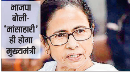
भाजपा बोली- 'मांसाहारी' ही होगा मुख्यमंत्री

ममता बनर्जी अपनी रैलियों में बीजेपी के सत्ता में आने पर खाने पीने की चीजों पर पाबंदी की आशंका जता रही हैं। चुनाव कैम्पेन के दौरान हाल ही में ममता बनर्जी ने अपने समर्थकों से कहा कि बीजेपी पश्चिम बंगाल में सत्ता में आती है, तो वह मछली, मांस और अंडे खाने पर बैन लगा देगी। बीजेपी में रैली में ममता बनर्जी कह रही थीं, ये लोग (बीजेपी वाले) आपको मछली नहीं खाने देंगे... आप अंडा, मीट कुछ नहीं खा पाएंगे और न ही बांग्ला बोल पाएंगे... अगर आपने ऐसा किया तो ये लोग आपको बांग्लादेशी घोषित कर देंगे।